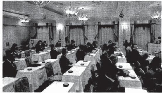
新春互礼会の様子