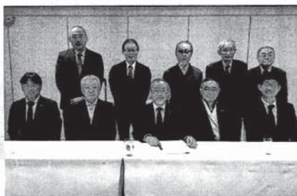
2023・2024年度 理事・監事